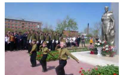
Митинг у памятника. 2012 год.