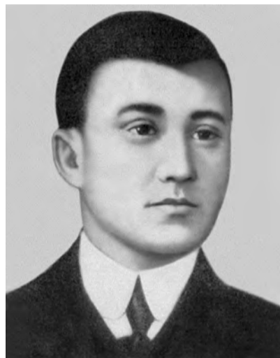
Ақын, ағартушы Сұлтанмахмұт Торайғыров 1893 жылы 28 қазанда

Солтүстік Қазақстан облысы Уәлиханов ауданында туған. 2 жасында шешесі қайтыс болып, 6 жасына дейін әжесінің тәрбиесінде болған. Кейін әкесі екі ұлымен Баянауылға көшіп, Торайғыр кентіне таяу жерге қоныстанған. Сұлтанмахмұт алғаш әкесінен ескіше хат танып, 13 жасынан молдалардан дәріс алды.