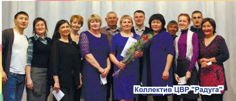
Коллектив ЦВР «Радуга»

Именно так учёные-филологи этимологически трактуют значение слова радуга. И действительно, всем известный Центр внешкольной работы «Радуга» в с. Шарбакты не первый год приносит счастье и радость многим детям и подросткам нашего района. Это радость творчества и счастье от достигнутых успехов и полученных итогов.