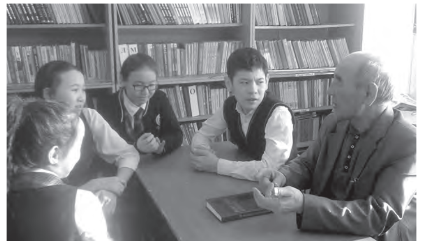
Страницу подготовила: Оспанова А., методист отдела образования, Лебяжинский район