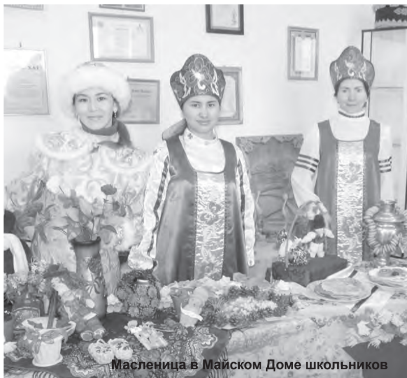
Масленица в Майском Доме школьников