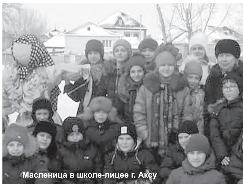
Масленица в школе-лицее г. Аксу