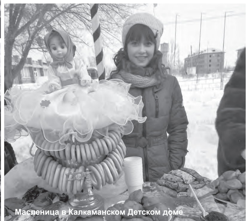
Масленица в Калкаманском Детском доме