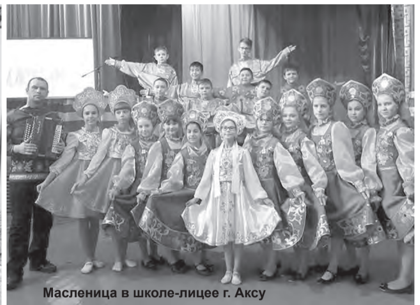
Масленица в школе-лицее г. Аксу