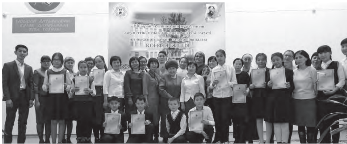
Ы. Алтынсариннің 175 жылдығына орай

Ы.Алтынсариннің мұрасын, туған елі үшін жасаған игі ісін білу, құрмет тұту – толассыз, тоқтаусыз құбылыс. Себебі Ы.Алтынсаринді тану - өзін мәдениетті, білімді санайтын әрбір азаматтың парызы. Ұлы ағартушының мұрасы - біз үшін өте бағалы қазына.