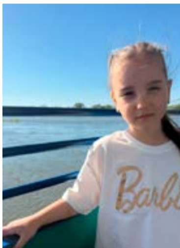
Спасибо, Павлодар, за добрые майские выходные.

Да, бабушка дома осталась, в Тимирязево, на хозяйстве. Дедушка молодой, он на работе, работает в КХ. Но мы обязательно проведем следующие майские праздники в кругу большой семьи.