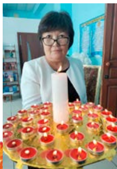
Библиотека. Я думаю, это – удивительное место. Это – целый мир. Мир, в котором живут чита-

тели и книги. Это работа творческих людей, которые находятся в поиске. Вот и на праздничном вечере мы в этом убедились.