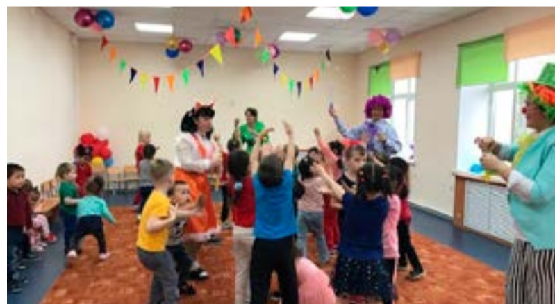
Детский сад «Айголек» село Константиновка