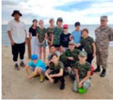
Наши учителя рассказали о технике безопасности на воде.

Наш отряд «Патриот» с нетерпением ждал тот день, когда мы поедем на озеро Маралды. Сначала в школе мы посмотрели фильм о безопасности на воде.