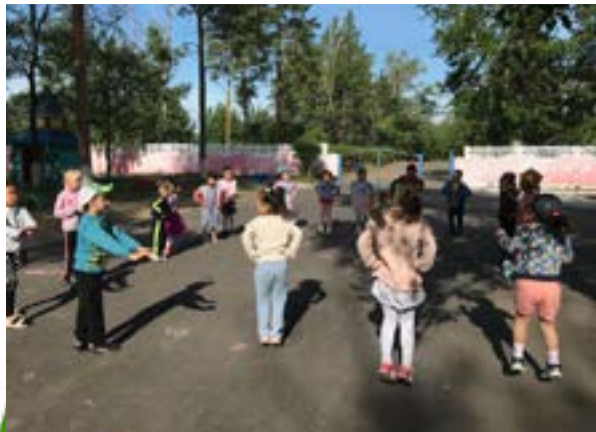
Детский сад «Айголек» село Константиновка

Территория распространения - Павлодарская область. Собственник и учредитель: ОО «Областная детско-юношеская организация Павлодарской области». Газета зарегистрирована в Министерстве культуры и информации Республики Казахстан. Регистрационное свидетельство о постановке на учет средств массовой инфор- мации №7917-Гот12.12.2006 г.