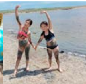
Павловская СОШ Успенский район