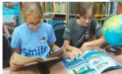
СОШ 43 г.Павлодар