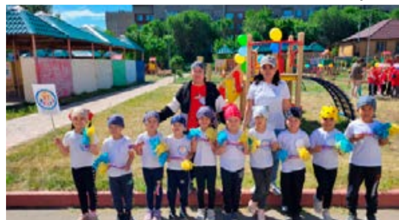
Детский сад № 37, г. Павлодар