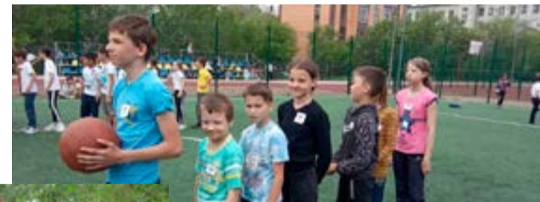
СОШ 15 г.Павлодар