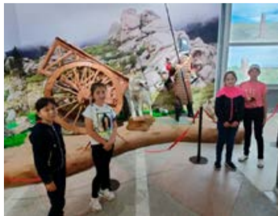
Павловская СОШ Успенский район