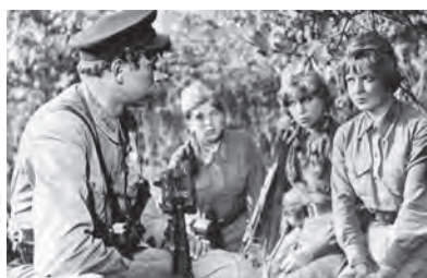
• Кадр из кинофильма «А зори здесь тихие», 1972 год. Режиссёр: Станислав Ростоцкий.

Патриотическое воспитание является одним из приоритетных направлений в системе образования Казахстана. Оно способствует формированию у молодежи высокого патриотического сознания, готовности к выполнению гражданского долга.