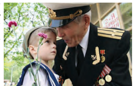
Материал «Айгөлек» балалар журналынан алынды, №5 (142)