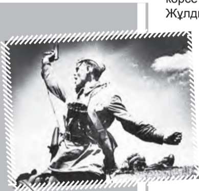
Суретте кіші саяси жетекші А. Г. Еременко, қазаға ұшырар алдында бірнеше секундтер қалғанда, сарбаздарды шабулға жинау үстінде.