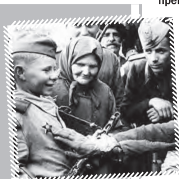
Награждение молодого героя.