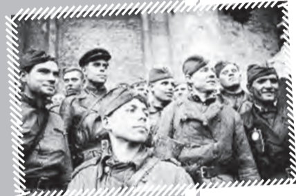
Солдаты, штурмовавшие рейхстаг. Берлин. Май 1945 год.