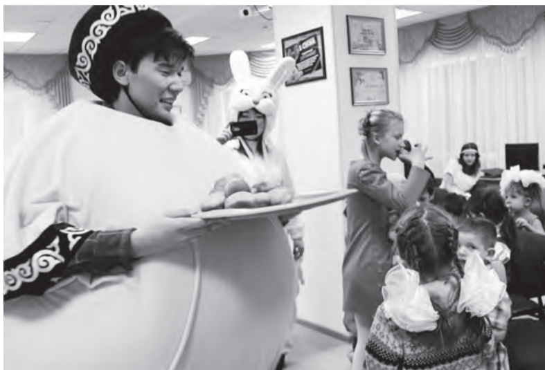
• Волонтеры Детского центра мира посетили Детскую деревню семейного типа с шоу-программой и угощениями.

команда помогает собрать средства на лечение больного раком человека, а завтра эти же люди могут искать спонсоров для приюта животных. И это совсем не означает, что волонтеры постсоветского пространства дилетанты или то, что они не знают, чем именно заниматься. Наоборот, такие волонтеры быстро реагируют на изменения условий в жизни города или даже страны.