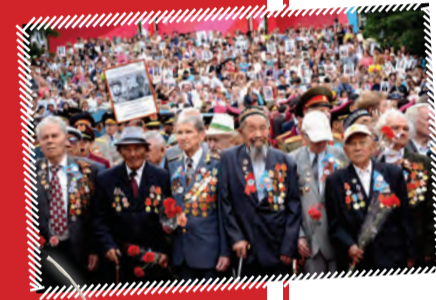
Жасотандықтардың бастамасымен, Павлодар қаласында ҰОС ардагерлерінің естеліктер кітабы баспаға шығарылады.

Украинада 1 Мамыр күні халық алаңда мереке ұйымдастырып, орманда серуен құрып, көуап дайындайды.