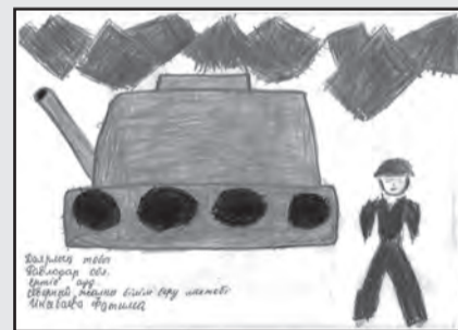
• Инсебаева Фатима

Рисунки учащихся Северной СОШ Цитынского района