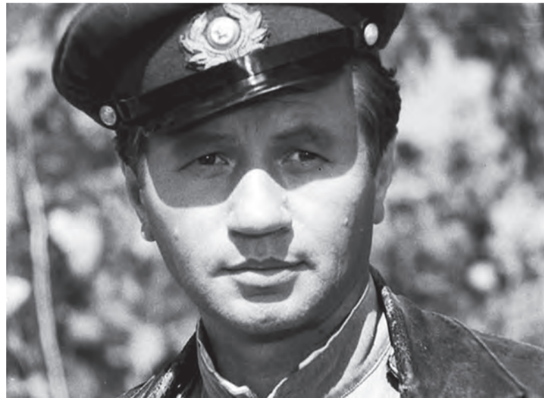
• Кадр из кинофильма «В бой идут одни «старики», 1973 год Режиссёр: Леонид Быков.

- формирование у школьников потребности в здоровом образе жизни.