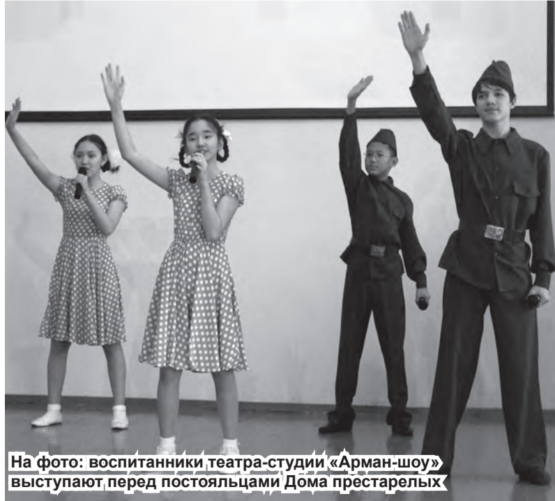
На фото: воспитанники театра-студии «Арман-шоу» выступают перед постояльцами Дома престарелых