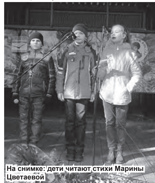
На снимке: дети читают стихи Марины Цветаевой