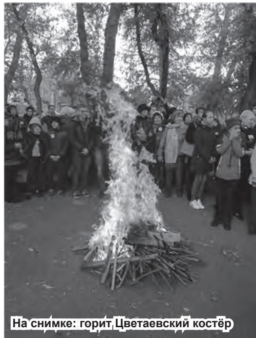
На снимке: горит Цветаевский костёр